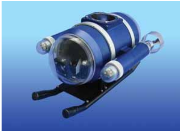
写真 5 - ROV 競技に使用した DELTA - 100R

また、今回初めての試みとして、株式会社キュー・アイより 4 台の有線式水中ロボット (ROV) をお借