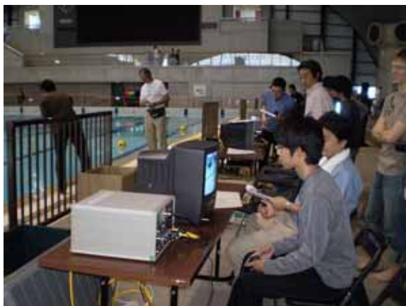
写真 6 - 真剣に ROV をオペレートする競技者

りし、中学生から社会人までを対象とした ROV 競技を行いました。これはプールに設置したラインをトレース、障害物を避けながらターゲットを目視するなどのミッションをこなすタイムレースです。この競技には 7 チームが応募し、東京海洋大学のチームが優勝しました。