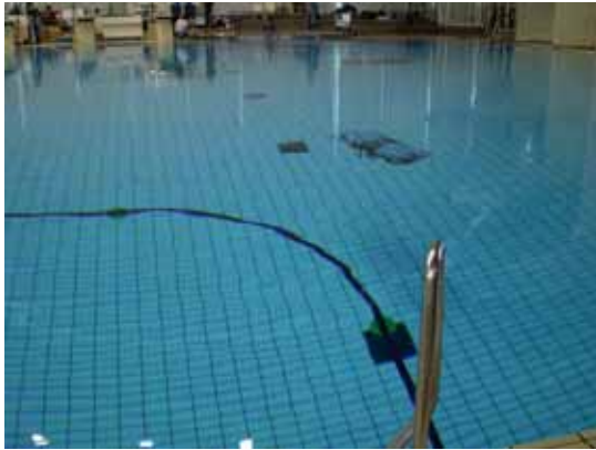
写真 4 - ライントレース中の「Twin-Burger」

前述の AUV 競技に参加できない水中ロボットには、フリースタイルという形式でロボットの特徴を、プレゼンとデモンストレーションで PR してもらい、その内容を審査するという形式で競技をおこないました。この部門では九州工業大学 石井研究室の「Amphibious Multi link Mobile Robot」が優勝しました。