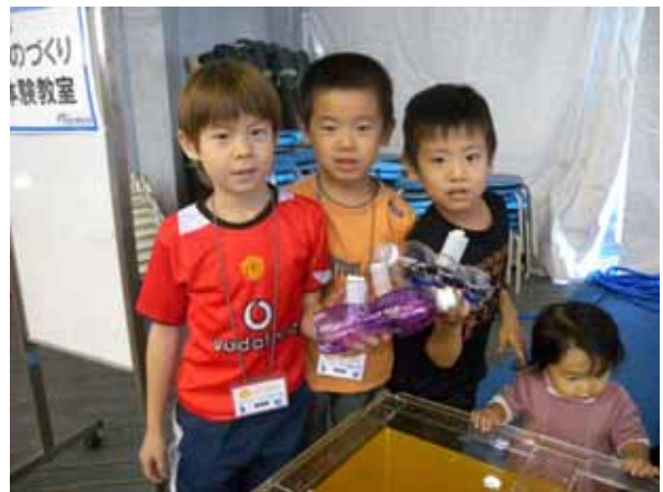
写真9 - ペットボトル潜水艦工作教室で作った力作を手にした子供たち