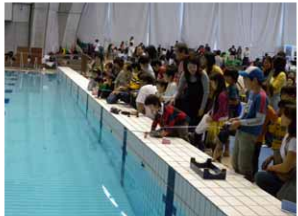
写真 7 - 盛況だった RC 潜水艦の体験操縦

体験操縦にご協力いただいた方々には、この場を借りて厚くお礼申し上げます。このほか、第 4 回海底世界一周ノーチラス号デザインコンテスト (N-con 2008) が同時開催され、海洋研究開発機構の展示・グッズ販売などもありました。