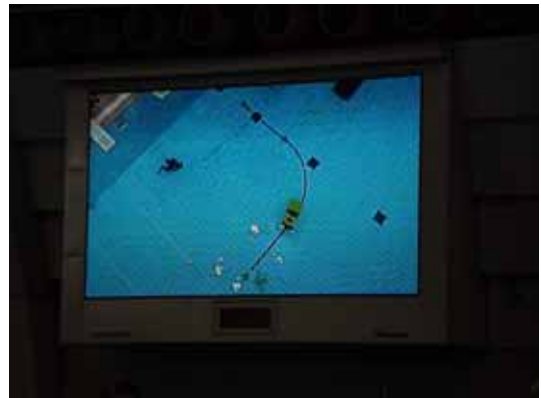
写真 3 - 大型映像装置の映像

司会のマイクと大型映像装置の映像によって、広い会場のなかで、観客が今どこに注目したらよいか、水中も含めて分かりやすくするという試みは、まだまだ反省点がありますが、従来より大きく改善されたと思います。