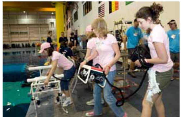
写真1 - ROV Competition (MATE のHP より)

これらのイベントにはスポンサーがついていて、International ROV Competition の場合、MTS、IEEE/OES、ウッズホール海洋研究所、スクリプス海洋研究所、モンレー湾水族館博物館、NASA、NOAA、NSF、米海軍などの公的機関に加えて、海底石油掘削関係の機器メーカー、AUV Competition