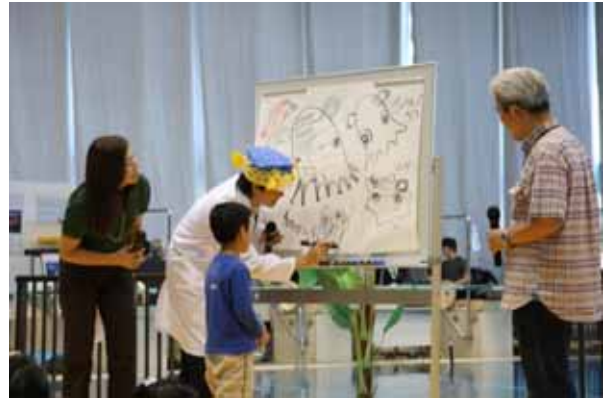
写真8 - さかなクンと田代氏のトークショー

いる団体各位の参加はもちろん、興味のある方はぜひご来場くださいますようお願い申し上げます。